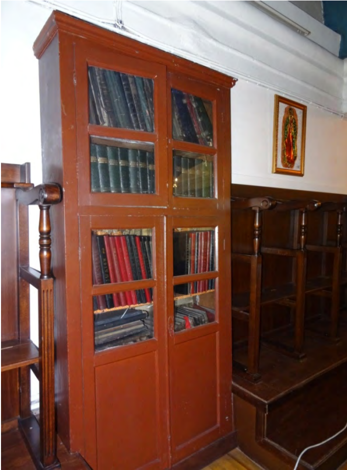
Ἡ βιβλιοθήκη, ὅπου φυλάσσεται ὁ κώδικας.