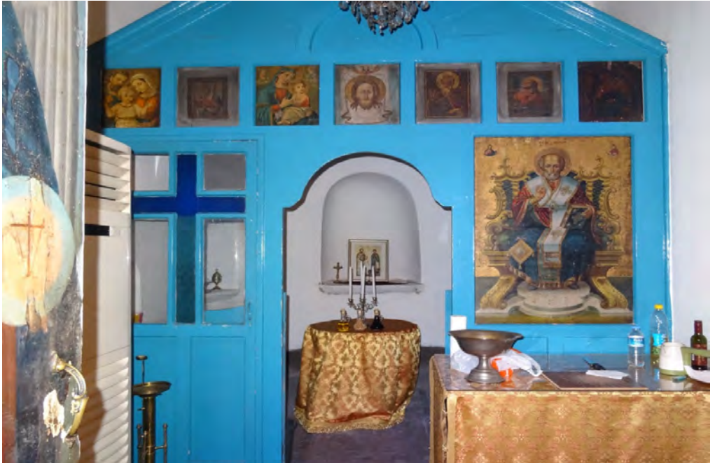
Τὸ παρεκκλήσι τοῦ Ἁγίου Νικολάου.