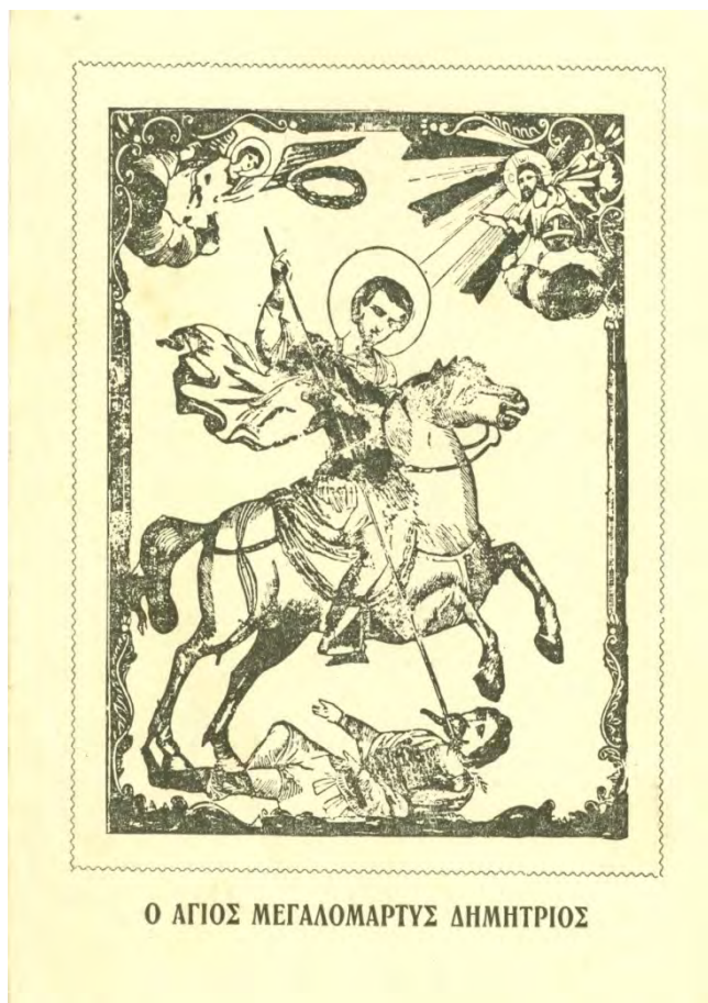
Έορταστικό δελτίο της κοινότητας Κουρούτσεσμε, 1963.