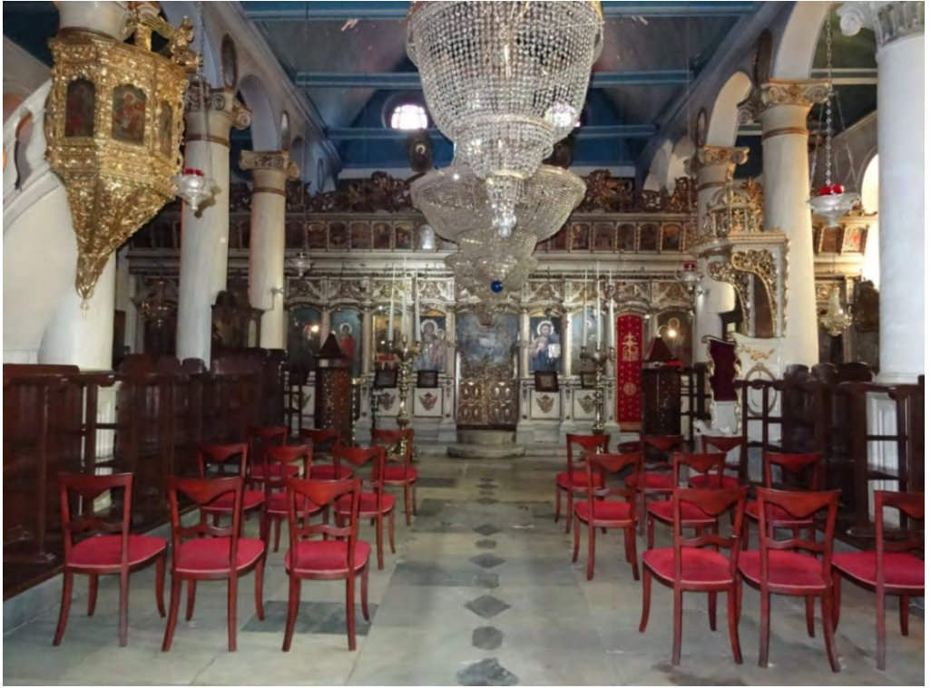
Άποψη από τὸ ἐσωτερικὸ τοῦ ναοῦ Ἁγίου Δημητρίου Κορούτσε- σμε.