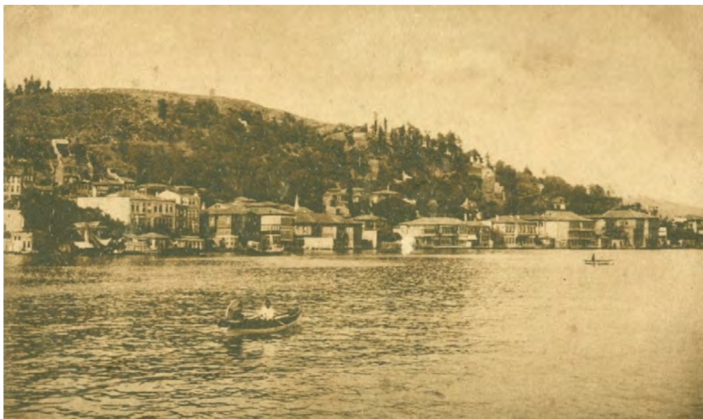
Ἡ Ξηροκρήνη (Κουρούτσεστε) στις ἀρχές τοῦ 20οῦ αἰῶνα.