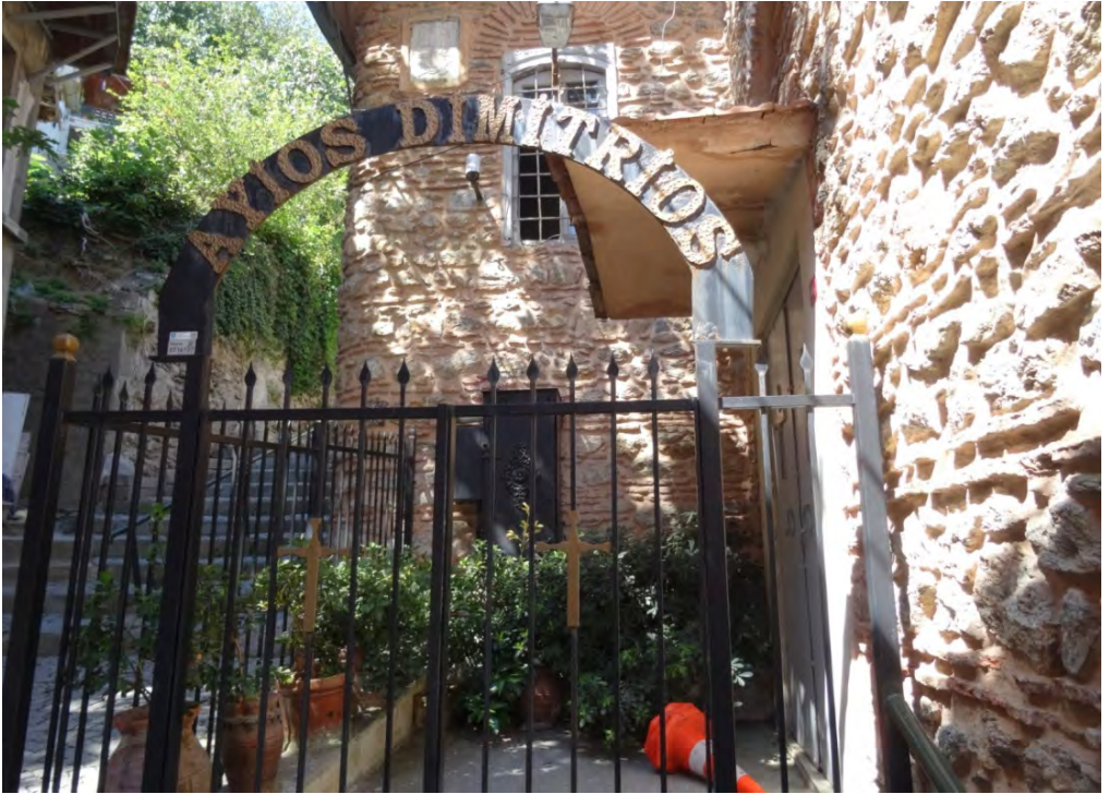
Ἡ εἴσοδος τοῦ Ναοῦ Ἁγίου Δημητρίου Κουρούτσεσμε.