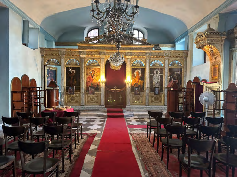
Τὸ ἐσωτερικὸ τοῦ ναοῦ Ἁγίου Ἰωάννου Κουρούτσεσμε.