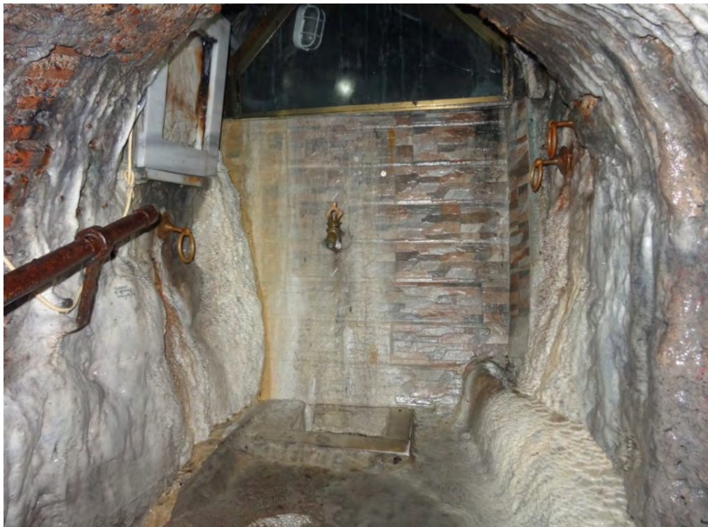
Τὸ θαυματουργὸ ἅγίασμα τοῦ Ἁγίου Δημητρίου Κουρούτσεσμε.