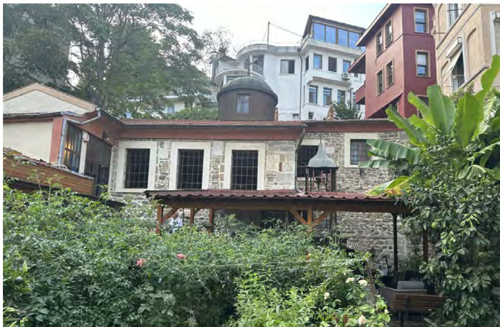
Ὁ ναὸς τοῦ Ἁγίου Ἰωάννου Κουρούτσεσμε.