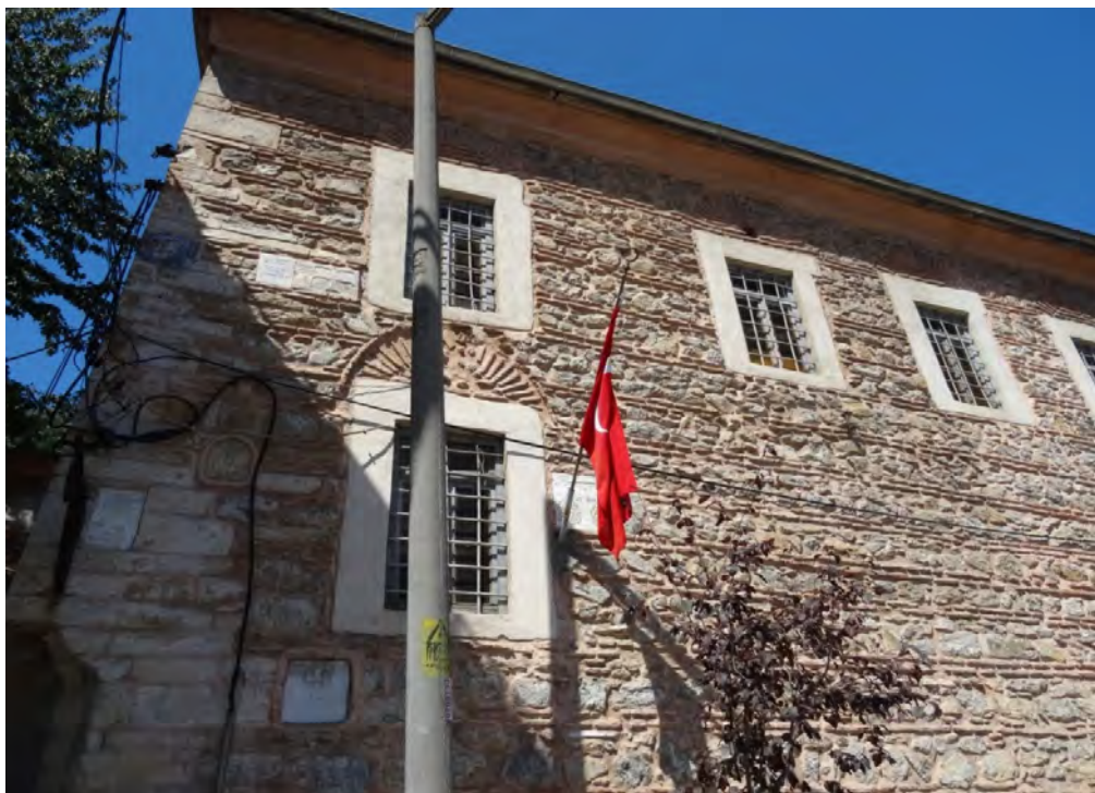
Ἐξωτερικὴ ἄποψη τοῦ Ἁγίου Δημητρίου Κουρούτσεσμε.